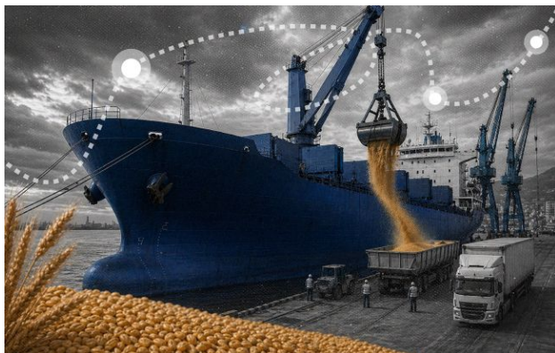
Крадене зерно

Між Україною та Ізраїлем спалахнув дипломатичний скандал через купівлю краденого зерна з тимчасово окупованих територій.