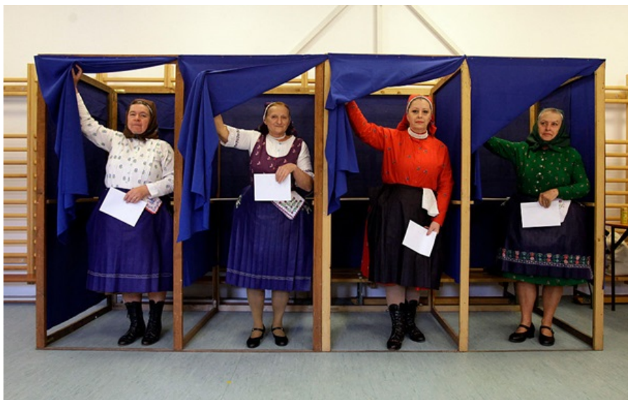
Явка виборців досягла показника у майже 80%

Виборчі дільниці в Угорщині закривалися з рекордною явкою, - на 18:30 вона становила 77,8%.