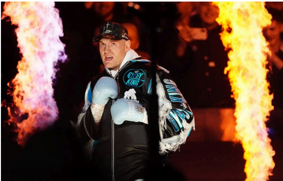
Тайсон Ф'юрі

Провідний стримінговий канал повідомив, що запланований бій між британськими боксерами відбудеться, і продемонстрував докази цього, щоб не бути голослівним.