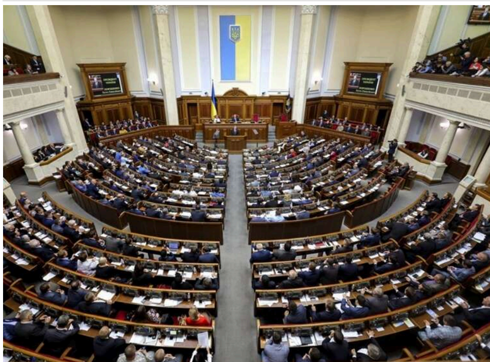
Верховна Рада підтримала в першому читанні новий проєкт Цивільного кодексу України

Депутати Верховної Ради підтримали в першому читанні проєкт нового Цивільного кодексу. За відповідне рішення проголосували 254 нардепи.