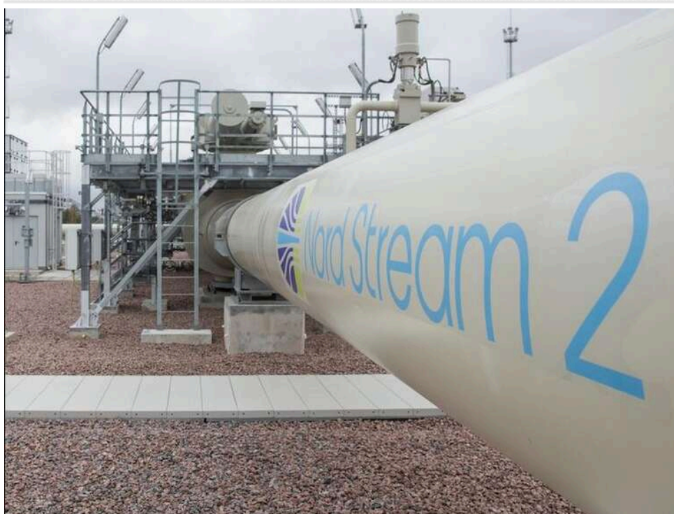
Повернення до російського газу: партія «АдН» вимагає відновити роботу «Північного потоку»

Німецька ультраправа партія "Альтернатива для Німеччини" хоче відновити роботу російського газопроводу "Північний потік".