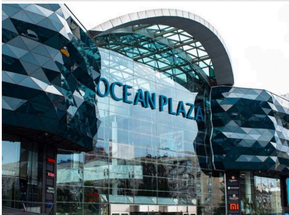
Старт від 100 мільйонів доларів: ФДМУ виставить Ocean Plaza на приватизаційний аукціон у третьому кварталі 2026 року

Фонд державного майна України планує виставити на прозорий аукціон державну частку столичного ТРЦ Ocean Plaza вже у третьому кварталі 2026 року, коли уряд затвердив графік продажу санкційних активів. Орієнтовна стартова вартість об'єкта становить близько 100 мільйонів доларів. Фонд уже веде попередні перемовини з потенційними покупцями.