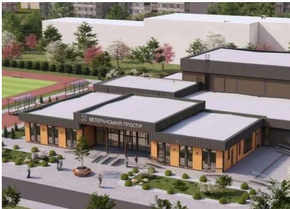
«Велике будівництво» ветеранських просторів: як команда Голика та Резніченка отримала контроль над проектом на мільярди

Журналісти з «NGL.media» повідомили, що будівництво нових ветеранських просторів супроводжується зривом термінів, завищеними цінами на матеріали та зв'язками із командою «великих будівельників» Валентина Резніченка та Юрія Голика.