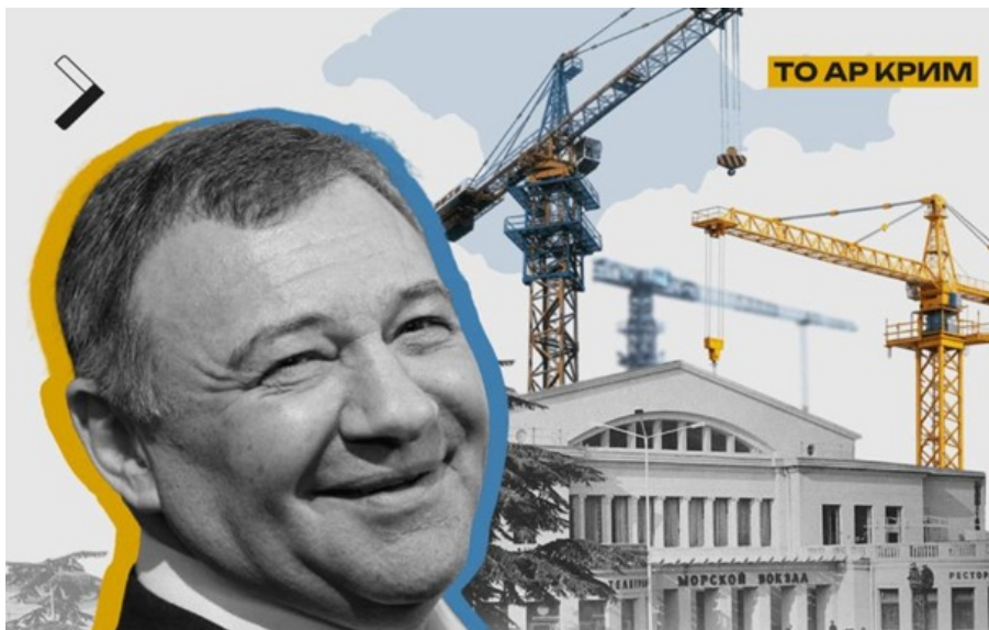
Аркадій Ротенберг заходить у Ялтинський порт

Російська влада планує розмістити на місці пасажирського терміналу ігорну зону з казино, готелями, спа-комплексами та розважальною інфраструктурою.