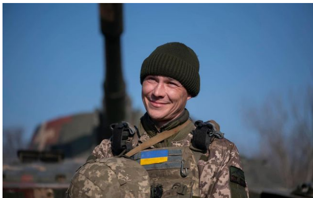
Фото: воєнний стан і мобілізацію в Україні продовжили ще на три місяці

Верховна Рада продовжила дію воєнного стану та загальної мобілізації ще на 90 діб. Відповідний правовий режим діятиме щонайменше до 2 серпня 2026 року.