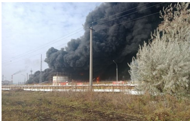
Фото: Сили оборони уразили одразу чотири об'єкти нафтопереробної галузі РФ (t.me/GeneralStaffZSU)

В рамках зниження воєнно-економічного потенціалу Росії у ніч на 18 квітня підрозділи Сил оборони України уразили одразу чотири важливих об'єкти нафтопереробної галузі РФ.