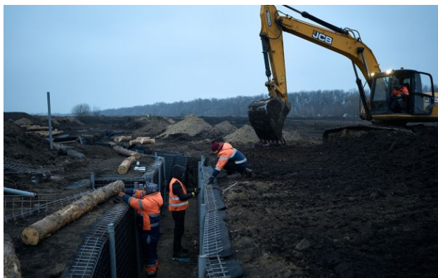
Фото: як Україна зміцнює північний кордон (Gettyimages)

Україна буде масштабу оборонну лінію вздовж північного кордону - від Київського водосховища аж до Сум. Мета - унеможливити будь-який новий наступ з боку Росії.