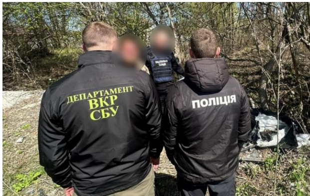
Фото: проведення обшуків у фігурантів справи

Поліція під час спецоперації "Чорна гільза" ліквідувала канал постачання "нагородної" зброї для політиків та пропагандистів РФ. Нелегальну зброю фігурантам передавав ватажок так званої "ДНР" Денис Пушилін.