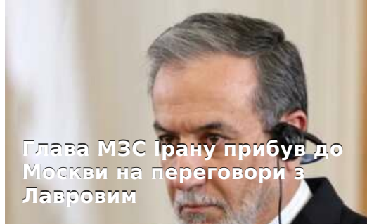
Глава МЗС Ірану прибув до Москви на переговори з Лавровим