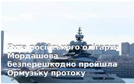
Яхта російського олігарха Мордашова безперешкодно пройшла Ормузьку протоку