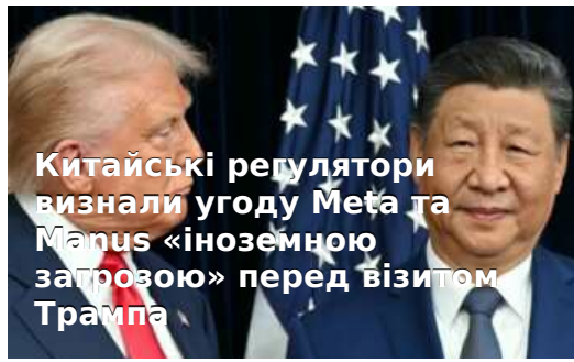
Китайські регулятори визнали угоду Meta та Mapus «іноземною загрозою» перед візитом Трампа