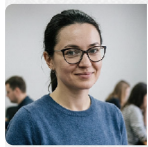
Юлія Більченко ВИПУСКОВИЙ РЕДАКТОР

Теги: США, Война, Війна, Іран, Іран, Дональд Трамп, Трамп