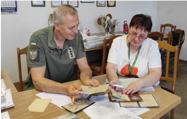
Фото: У ПФУ пояснили, як розраховують пенсії

В Україні розмір пенсії за віком визначається індивідуально - він залежить не лише від стажу, а й від рівня офіційної зарплати.