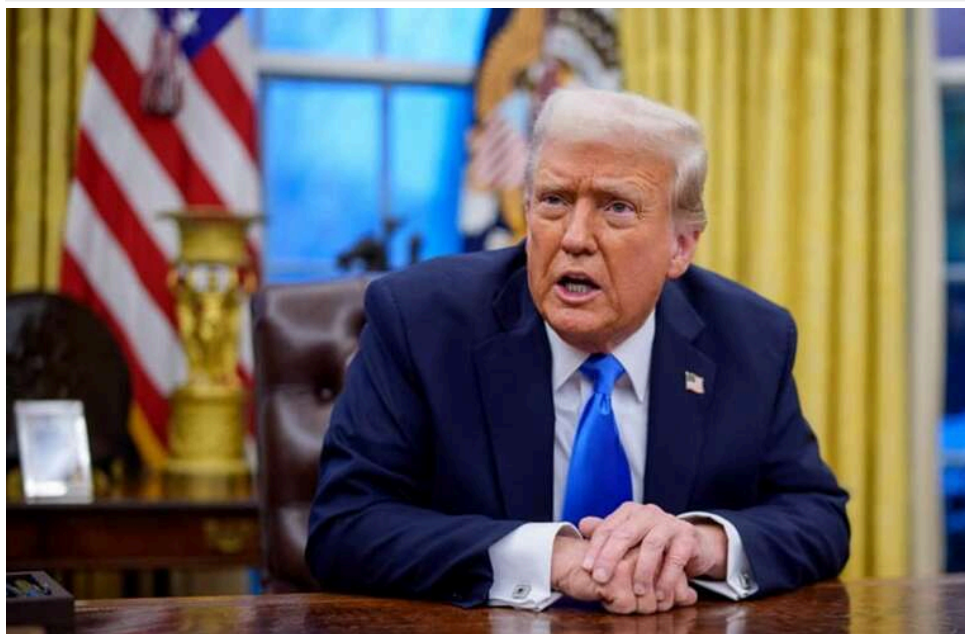
NYT: Дональд Трамп відхилив нову мирну пропозицію Ірану

За словами кількох осіб, обізнаних з ходом обговорень, що відбулися в понеділок у Ситуаційній кімнаті Білого дому, президент США Дональд Трамп повідомив своїм радникам, що він незадоволений останньою пропозицією Ірану щодо відкриття Ормузької протоки та припинення конфлікту.