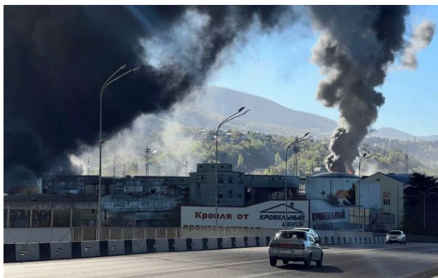
Фото: у Туапсе горить НПЗ після нової атаки дронів, місцевих евакуюють (росЗМІ)

У Туапсе розгорілися масштабні пожежі після нової атаки безпілотників на нафтопереробний завод і морський термінал. Місцева влада оголосила евакуацію.