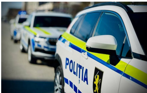
Фото: у столиці Молдови виявили об'єкт, схожий на дрон (facebook.com/politiarepublicimoldova)

На даху багатоповерхівки у центральному районі столиці Молдови, міста Кишиніва, виявили об'єкт, схожий на дрон.