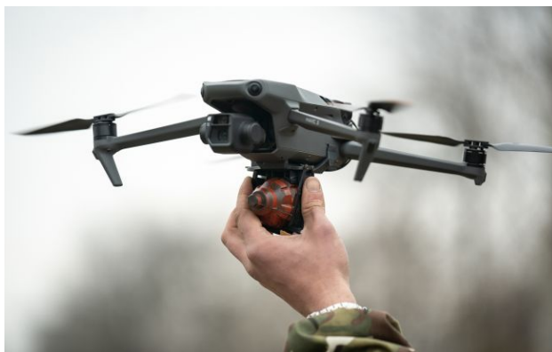
Фото: у столиці Молдови виявили об'єкт, схожий на дрон (Getty Images)

На даху багатоповерхівки у центральному районі столиці Молдови, міста Кишиніва, виявили об'єкт, схожий на дрон.