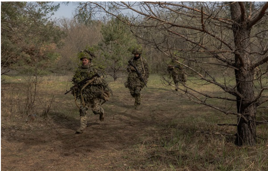
Українські військовослужбовці 33-ї окремої механізованої бригади на Харківщині