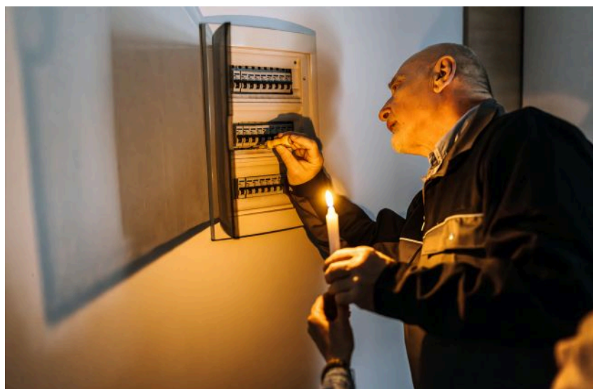
Дехто з українців залишився без світла через негоду