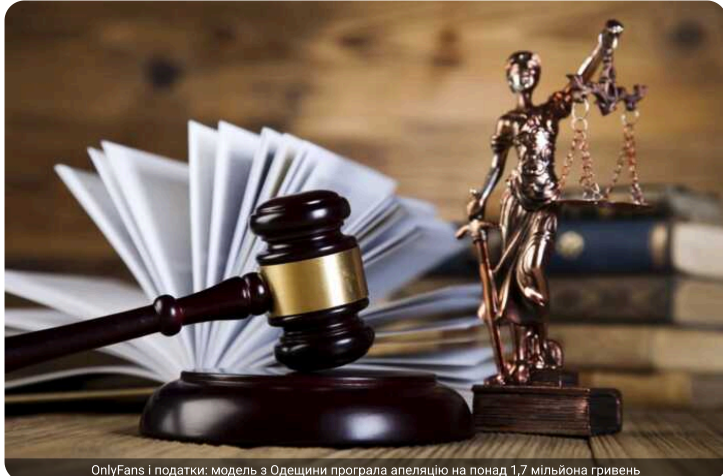
OnlyFans і податки: модель з Одещини програла апеляцію на понад 1,7 мільйона гривень

П'ятий апеляційний адміністративний суд залишив у силі рішення про донарахування понад 1,7 млн грн податків і штрафів мешканці Одеської області, яка отримувала доходи з платформи OnlyFans, але не декларувала їх.