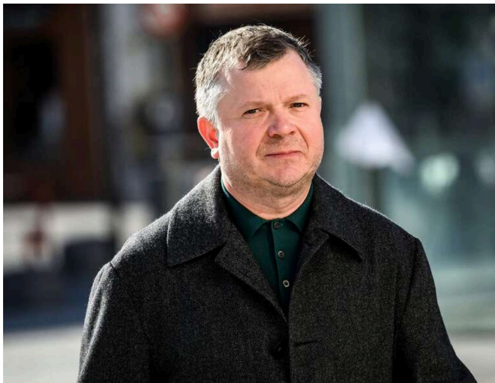
Суд дозволив ДБР розпочати спецрозслідування щодо Жеваго в справі про розтрату 113 мільйонів доларів

Суд санкціонував проведення ДБР спеціального розслідування щодо українського бізнесмена Костянтина Жеваго за фактом розтрати 113 млн доларів банку «Фінанси і Кредит».