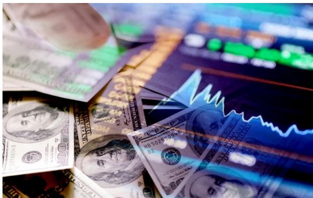
Фото: обмінники та банки оновили курс валют

Ранок вівторка розпочався із помітного подорожчання іноземної валюти на українському ринку. Найбільші системні банки, зокрема ПриватБанк та Монобанк, суттєво оновили свої цітники, додавши до вартості долара та євро до 20 копійок порівняно з попереднім днем.