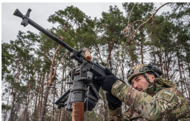
Фото: сили ППО збили майже сотню ворожих дронів (Getty Images)

Російські війська вночі атакували Україну ударними безпілотниками. Більшість ворожих цілей вдалось збити, але є й влучання.