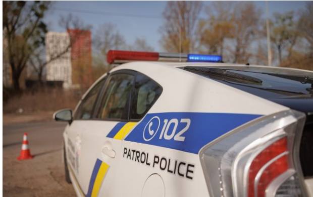
Фото ілюстративне: у Києві чоловік погрожував зброєю перехожим

У столиці поліцейські затримали чоловіка, який гуляв із пістолетом по вулиці та погрожував перехожим. Йому оголосили підозру.