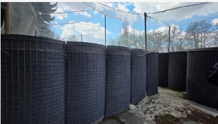
Габіони та антидронові сітки у Нікополі. Суспільне Дніпро

Для протидії атакам по району застосовують всі можливі засоби, зокрема антидронові сітки, зазначив він. Це ще один засіб пасивної оборони, який допомагає захистити місцевих жителів. Проте він сітки працюють лише у комплексі з активною радіоелектронною боротьбою, дронами-перехоплювачами та мобільними вогневими групами.