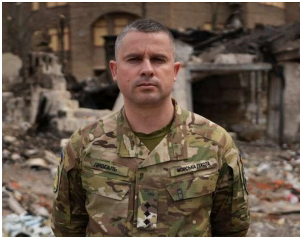
Дроновий терор подвоївся: РФ щомісяця випускає по Нікопольщині до 2000 безпілотників

Від березня 2026 року в Нікопольському районі Дніпропетровщини посилюються дроніві атаки. За місяць РФ може використовувати близько 2000 безпілотників різних типів, завдаючи ударів як по інфраструктурних об'єктах, так і по цивільному населенню.