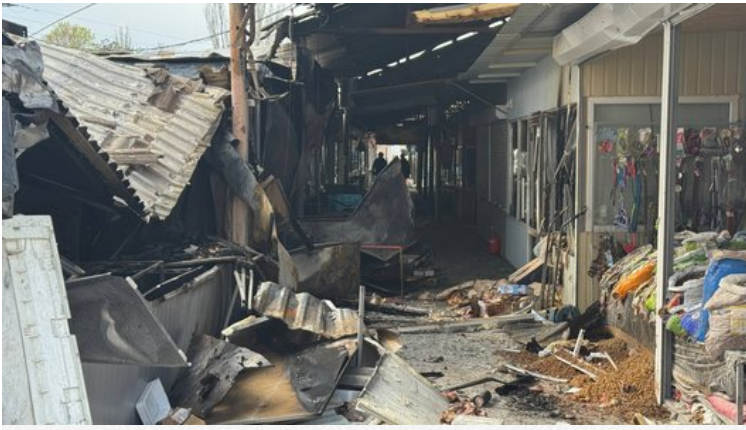
Наслідки удару РФ по ринку в Нікополі 5 квітня 2026 року.

Павло Дрогаль додав: через невдачі на лінії бойового зіткнення, РФ почала активно тероризувати цивільне населення: почастишали атаки по автомобілях та громадський місцях. Крім того, росіяни намагаються дестабілізувати обстановку в місті, розкидаючи листівки з пропагандистськими закликами.