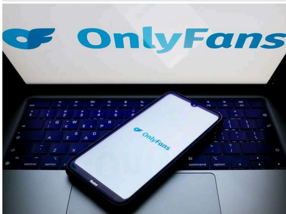
Податки з OnlyFans: суд Одеси зобов'язав модель сплатити 1,7 мільйона гривень до бюджету

П'ятий апеляційний адміністративний суд м. Одеси залишив чинним рішення про донарахування податкових зобов'язань мешканці Одеської області, яка отримувала доходи від платформи OnlyFans, але не декларувала їх.