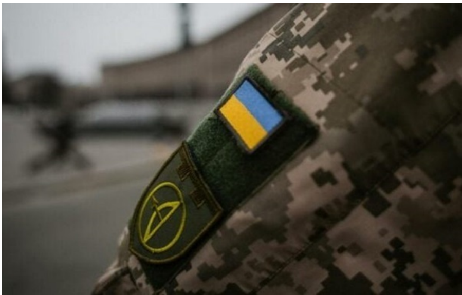
Фото: Соцмережі (ілюстративне фото)

Найбільше скарг на ТЦК стосуються мобілізації та ВЛК