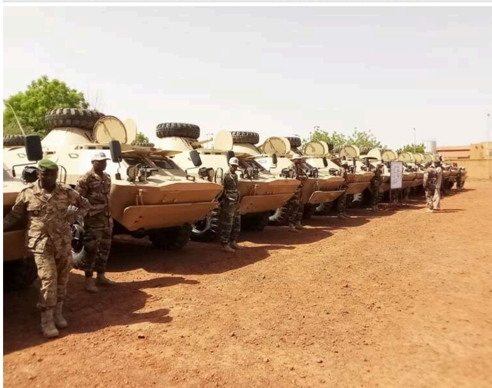
У Малі бойовики JNIM змусили відступити війська хунти та «Африканського корпусу» РФ

У Малі повстанці угруповання "Джамаат Нусрат аль-Іслам валь-Муслімін" (JNIM) вигнали бійців малійської хунти, яку підтримують російські бойовики "Африканського корпусу", зі ще однієї військової бази та населеного пункту Тессіт.