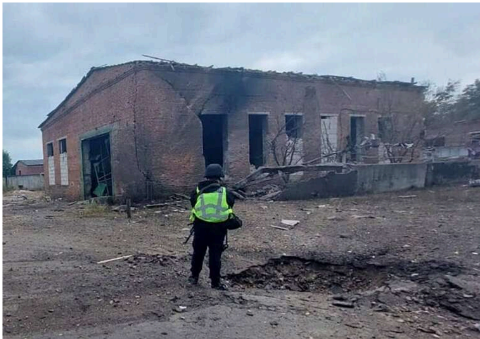
Росія знову атакувала Запоріжжя: є поранені серед мирного населення