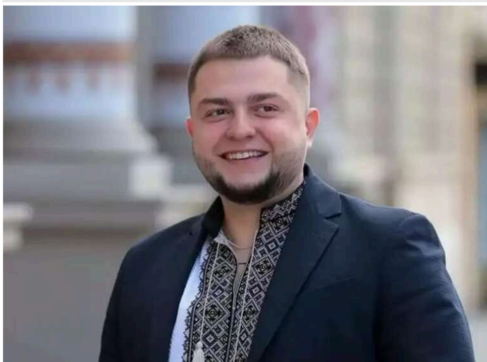
Сімейні тендери та мільйонні дарунки: як заступник голови Львівської облради Юрій Холод поєднує владу з родинним бізнесом

Заступник голови Львівської облради Юрій Холод вказав новий BMW, квартиру та подарунок у 2 млн гривень для дружини.