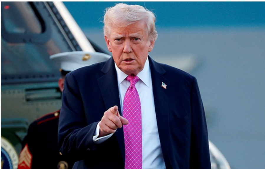
Трамп дав Ірану 48 годин

Президент США нагадав, що спливає дедлайн для укладення угоди або відкриття Ормузької протоки.