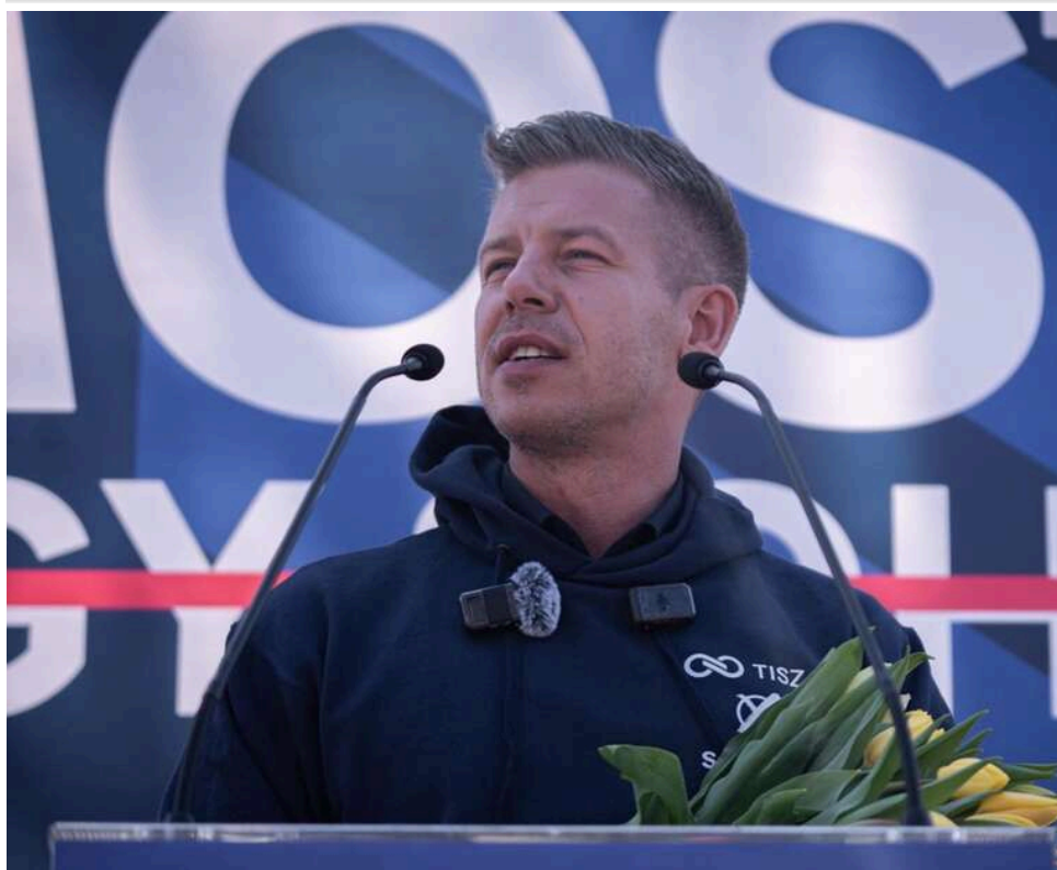
Угорські медіа заявили про «план Майдану» від опозиції: Петер Мадяр назвав це відчайдушною брехнею «Фідес»

У неділю вранці угорські медіа, контрольовані «Фідес» – Index.hu , Mandiner.hu , Hirado.hu та Origó.hu – повідомили про «витік внутрішнього документа» зі штабу партії «Тиса», в якому англійською мовою детально зазначено, що Петер Мадяр має оголосити про перемогу в ніч виборів до оголошення офіційних результатів, і що опозиція готується до насильницьких протестів у разі поразки.