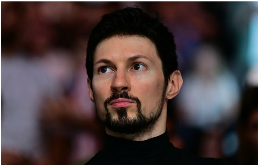
Павло Дуров

Попри обмеження, 65 мільйонів громадян РФ досі використовують Telegram щодня через VPN, зазначив засновник месенджера.