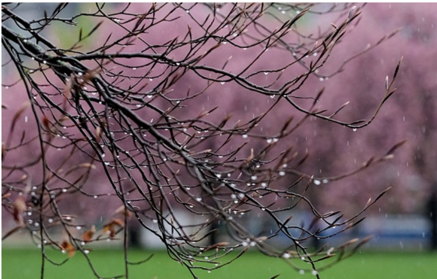
Синоптики розповіли про погоду на початку тижня

У більшості регіонів прогнозують періодичні дощі, нічні заморозки на ґрунті та поступове підвищення денної температури.