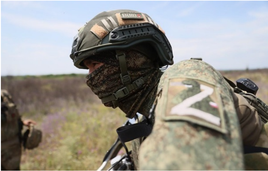
Окупанти просунулися на Дніпропетровщині та Донеччині

За минулу добу просування росіян зафіксовано у Донецькій та Дніпропетровській областях.