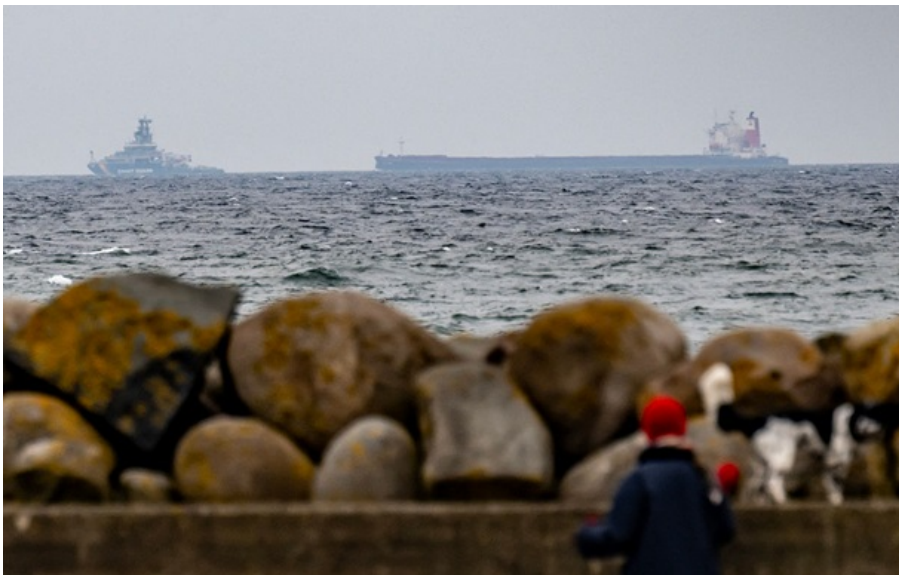
У Швеції розслідують забруднення Балтійського моря