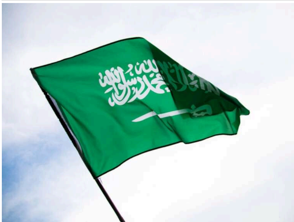
Саудівська Аравія відновила роботу нафтопроводу «Схід-Захід» для обходу Ормузької протоки, – Bloomberg

Саудівська Аравія офіційно оголосила про повне відновлення експлуатації нафтопроводу «Схід-Захід», що дозволяє транспортувати сировину в обхід вразливої Ормузької протоки.