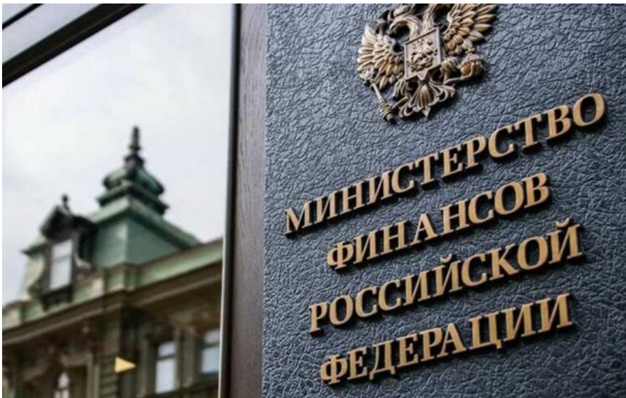
В РФ посилюється бюджетна криза

За два місяці року касовий розрив уже перекрив весь річний плановий показник у 50,5 млрд доларів, що говорить про цілковиту втрату контролю над фінансовою траєкторією.