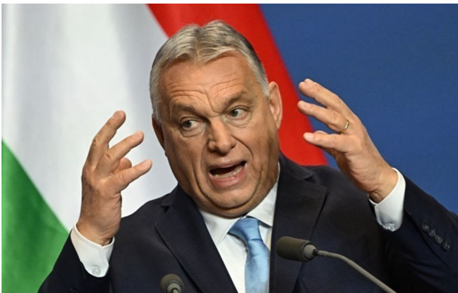
Прем'єр Угорщини Віктор Орбан