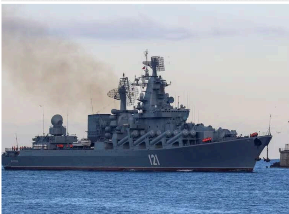
«Морська клітка» Новоросійська: Чорноморський флот РФ опинився у пастці без можливості відступу

Після атак ЗСУ на окупований Севастополь Росія була змушена перемістити свій Чорноморський флот до порту Новоросійськ у Краснодарському краї. Але і там вже небезпечно, а інших локацій для відступу немає.