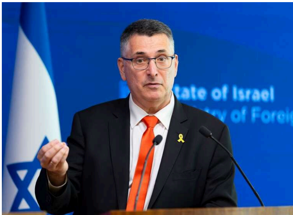
Глава МЗС Ізраїлю заявив про відсутність доказів у звинуваченнях України щодо викраденого зерна

Міністр закордонних справ Ізраїлю Гідеон Саар відреагував на заяву очільника МЗС України щодо виклику посла Ізраїлю до українського зовнішньополітичного відомства у зв'язку з прибуттям до Хайфи судна з викраденим РФ українським зерном, наголосивши, що висунуті звинувачення не підкріплені доказами.