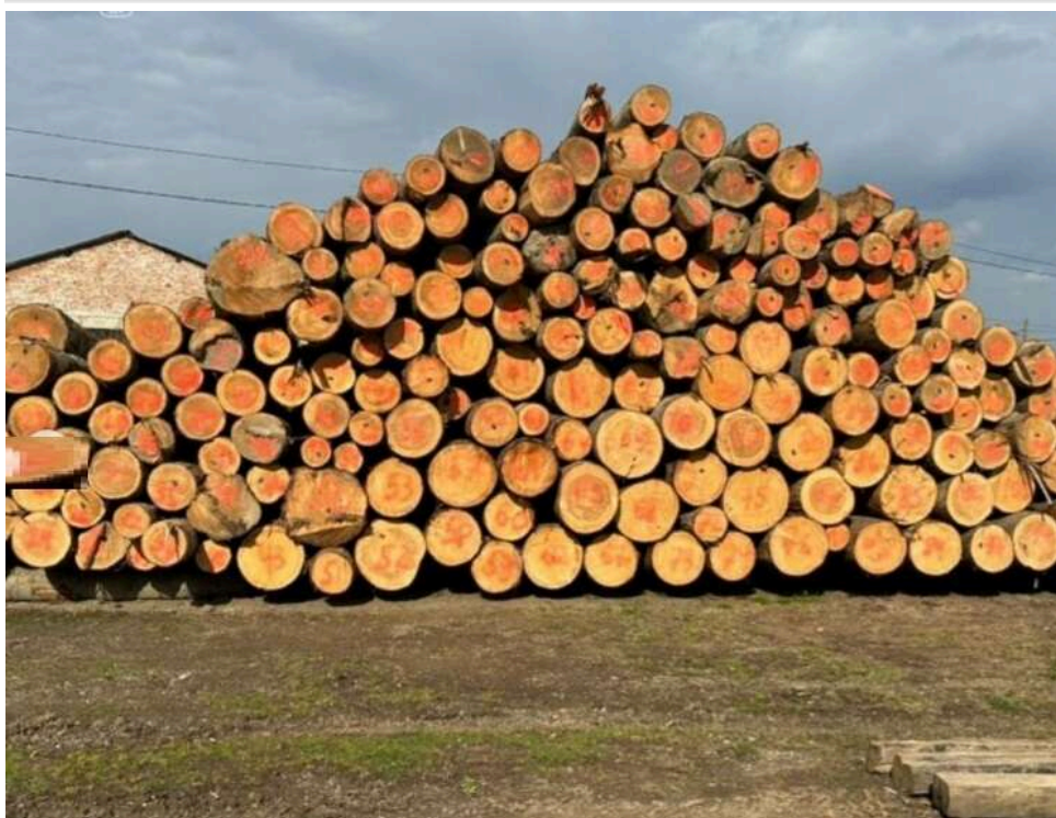
На Буковині викрили масштабну схему незаконного експорту деревини до Молдови, – прокуратура

26 обшуків, 1000 кубів деревини і мільйони готівки – на Буковині зупинено тіньовий експорт деревини.