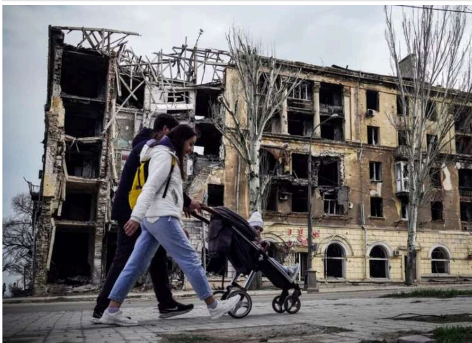
У Маріуполі окупаційна влада будує іпотечне житло переважно для громадян РФ, – міськрада