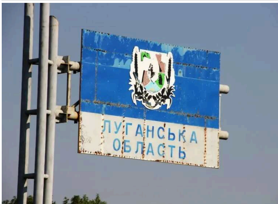
В окупованому Луганську заявили про «націоналізацію» 150 комерційних об'єктів

Окрім квартир з ознаками безгосподарського майна, у місті нараховується 150 об'єктів комерції, які можуть належати до цієї категорії.