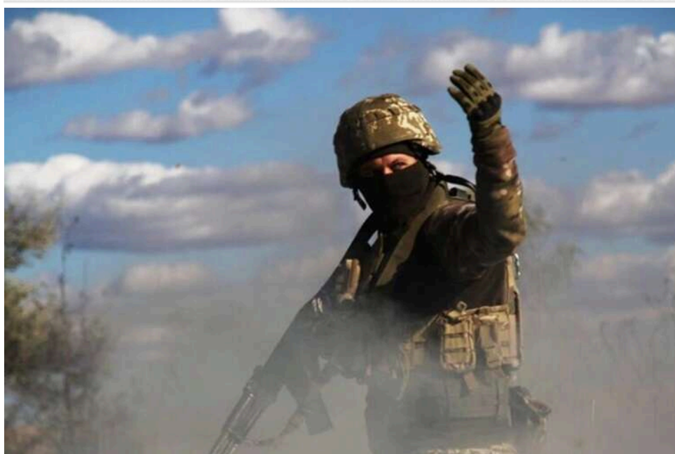
Ситуація на фронті: понад 180 зіткнень за добу, ворог масовано атакує на Покровському та Гуляйпільському напрямках