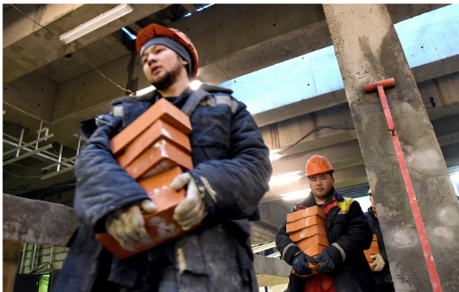
Кількість мігрантів у Росії сягає 20 млн осіб

👍 0 👍 0 ЧИТАТИ НОВИНУ РОСІЙСЬКОЮ 👁️ 19519