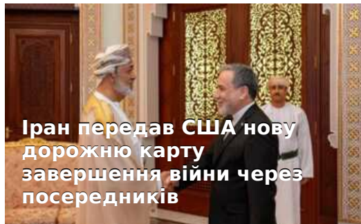
Іран передав США нову дорожню карту завершення війни через посередників