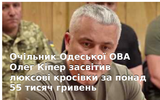
Очільник Одеської ОВА Олег Кіпер засвітив люксові кросівки за понад 55 тисяч гривень