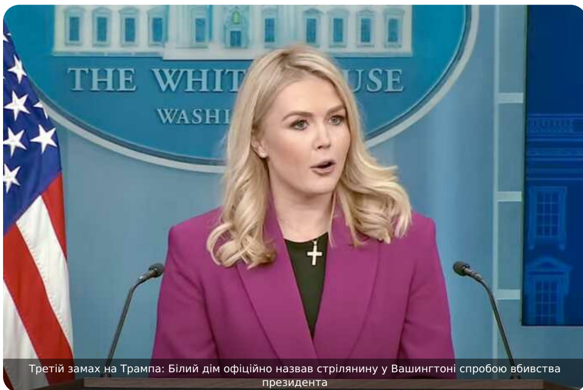
Третій замах на Трампа: Білий дім офіційно назвав стрілянину у Вашингтоні спробою вбивства президента

Речниця Білого дому Керолайн Левітт заявила, що стрілянина у вашингтонському готелі 25 квітня є третьою спробою вбивства президента США Дональда Трампа.