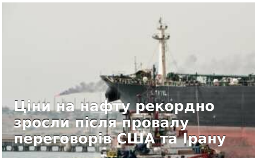
Ціни на нафту рекордно зросли після провалу переговорів США та Ірану