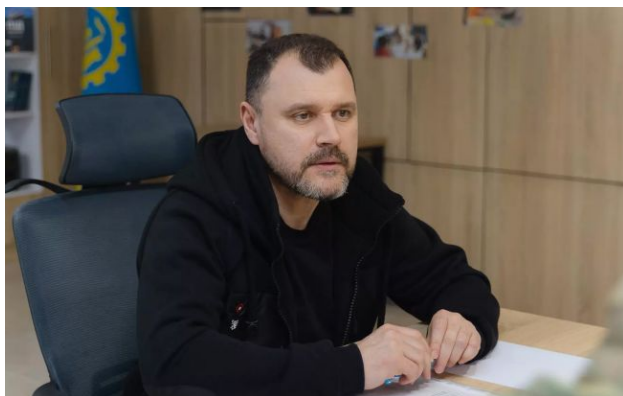
Фото: Ігор Клименко, міністр внутрішніх прав (mvs.gov.ua)

Консультації щодо закону про цивільну зброю почнуться цього чи наступного тижня. Обговорення документу буде загальнодержавним.